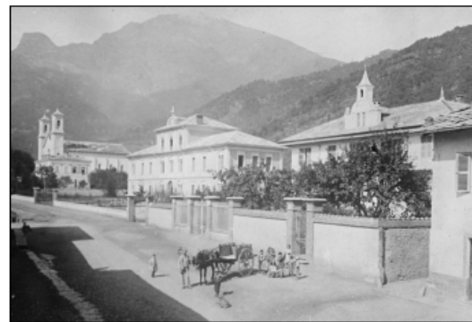
Il quartiere fotografato dall'attuale via Arnaud nel 1889.

Di fronte alla Casa Unionista si allineano le ex Casa dei Professori del Collegio Valdese: una serie di cottages con giardinetto e siepe di cinta, esempio interessante di architettura anglosassone, riprova della presenza europea nello spazio valdese.