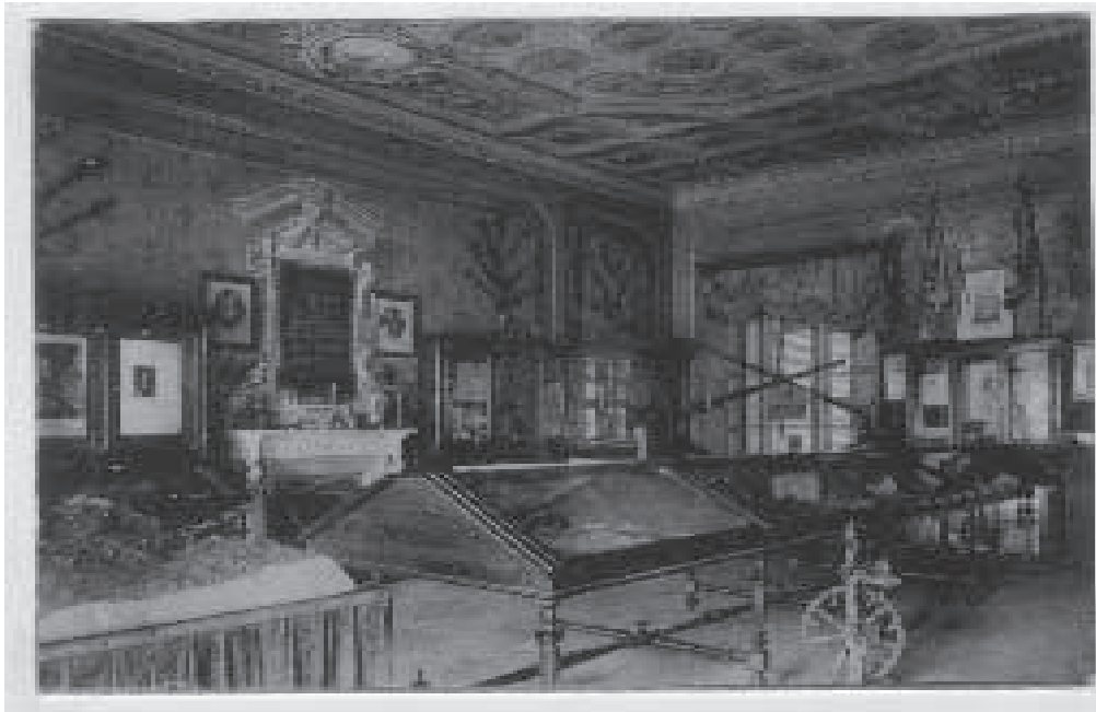
Il Museo valdese nell'allestimento del 1889.