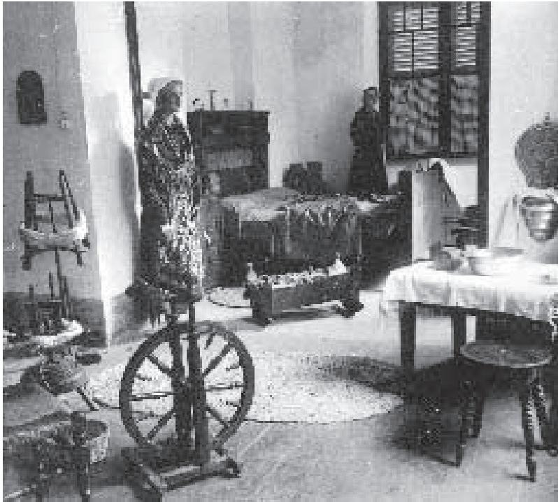
Il Foyer Vaudoise, 1937.