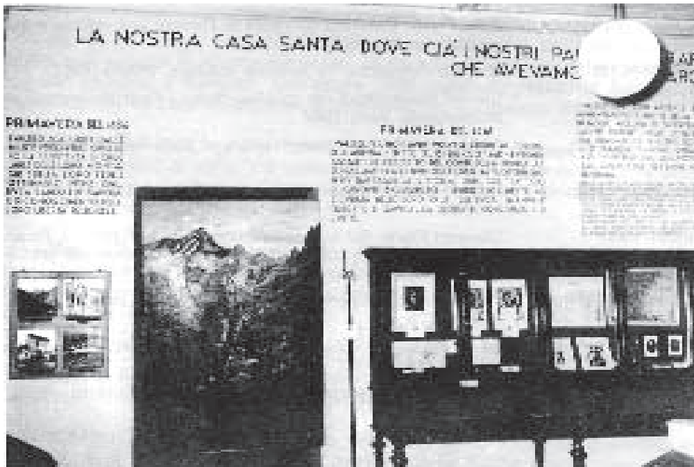
La "Sala della Persecuzione e del Rimpatrio": parete nord (Torre Pellice. Archivio fotografico Valdese).