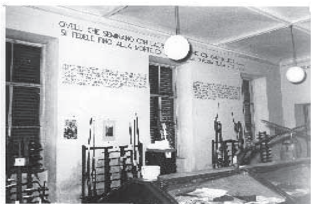
La "Sala della Persecuzione e del Rimpatrio": parete sud (Torre Pellice. Archivio fotografico Valdese).