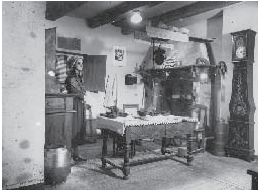
La cucina valdese alla mostra della montagna di Torino, 1938.