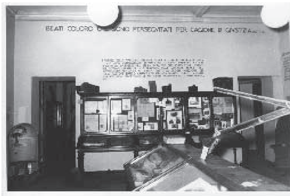
La "Sala della Persecuzione e del Rimpatrio": parete ovest (Torre Pellice. Archivio fotografico Valdese).

to 21 . Il bozzetto dello scultore romano giunse al Museo verosimilmente tramite Paschetto il quale fu anche, con ogni probabilità, colui che propose ai promotori dell'iniziativa dell'innalzamento del monumento a Gianavello il nome di Publio Morbiducci. Paschetto conosceva personalmente il suo quasi coetaneo Morbiducci e ne apprezzava particolarmente l'opera 22 .